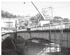
長野県 飯田建設事務所 松川橋 補修・補強工事