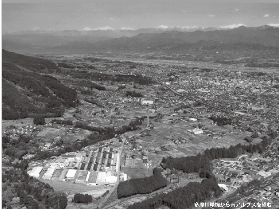
多摩川精機から南アルプスを望む