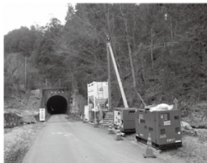
泰阜村 万古隧道 災害防除工事