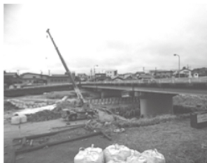
飯田市 新久米路橋 耐震補強工事